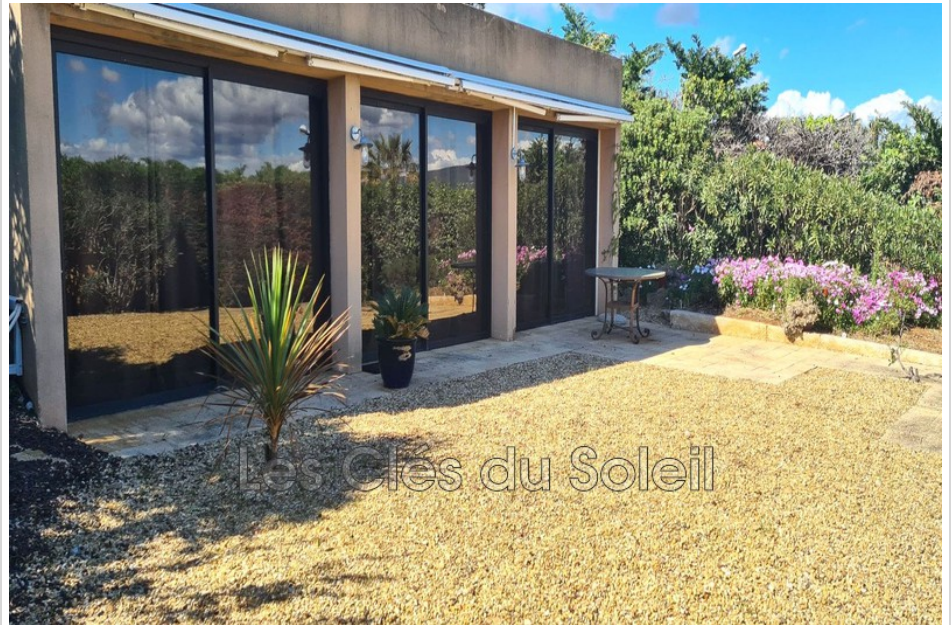
Maison 3947 La Ciotat

Venez découvrir cette charmante maison individuelle située dans le paisible quartier de La Ciotat. Bâtie en 1995, cette propriété de plain-pied, bénéficiant d'une exposition sud-est, offre une surface habitable de 117 m 2 sur un terrain de 575 m 2 avec une dépendance de 21 m 2 aménagée en studio. Elle se compose de deux chambres confortables, d'une salle de bain, et d'un lumineux séjour de 41 m 2 . La cuisine est aménagée pour une utilisation immédiate. Outre son cadre calme, elle bénéficie de prestations telles que le double vitrage et une chambre de plain-pied. L'extérieur n'est pas en reste avec une vue verdoyante sur le jardin, une terrasse conviviale et un parking privé. Chauffage et eau chaude sont assurés par une installation électrique. Une véritable opportunité à saisir ! Les Clés Du Soleil 07.63.62.42.39